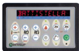
CONSOLE COMANDI CONTROL PANEL