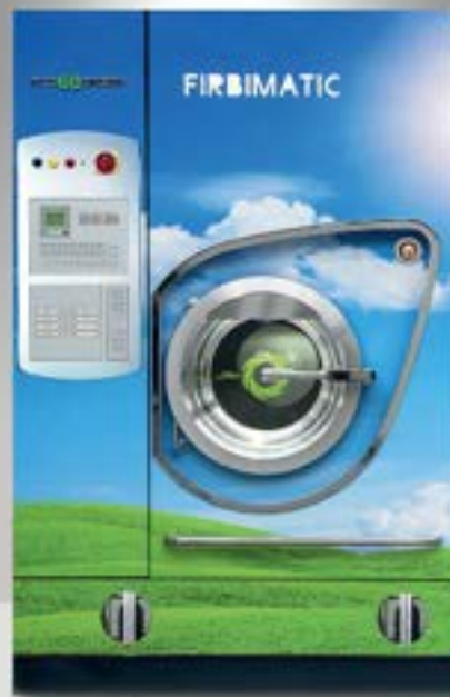
S2125/EcoGreen Petite 60